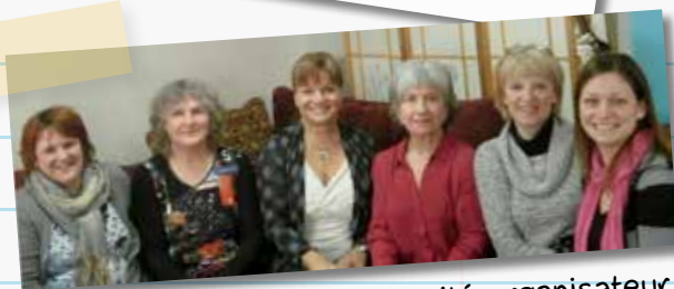
Le comité organisateur

Veillez prendre note que votre bulletin hebdomadaire Mon petit Partenaire prendra lui aussi «relâche» pour les deux prochaines semaines : retour le 18 mars!